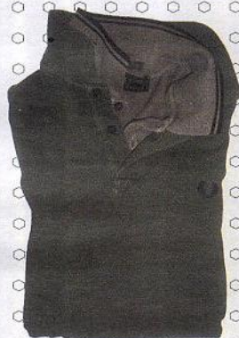
Polo piquet old style, Fred Perry.