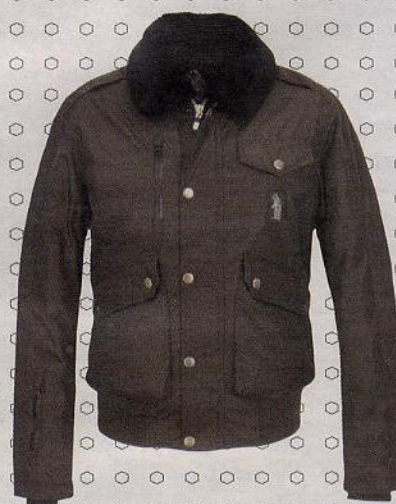
Bomber da aviazione, Refrigue.