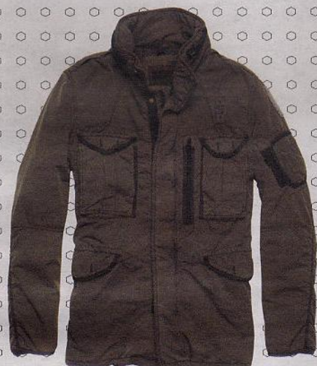
Multitasche super light, Blauer.