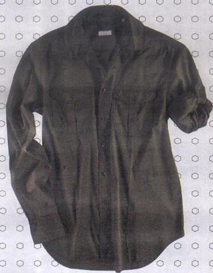
Verde militare, Chionna 9.2.

– Il fascino della divisa, le nuance della terra, la rivincita del comfort.