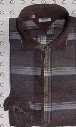
Mix di tessuti, Del Siena.