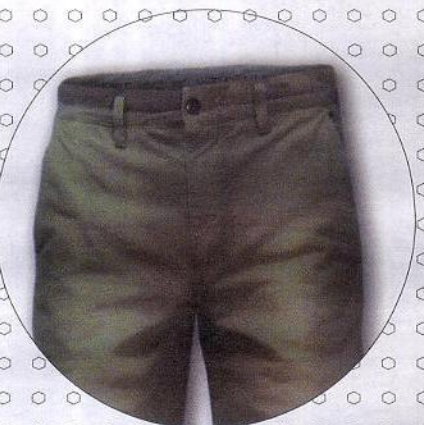
Indossato anche da JFK, Avirex.