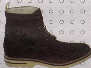
Anfibio d'ordinanza, Brimarts.