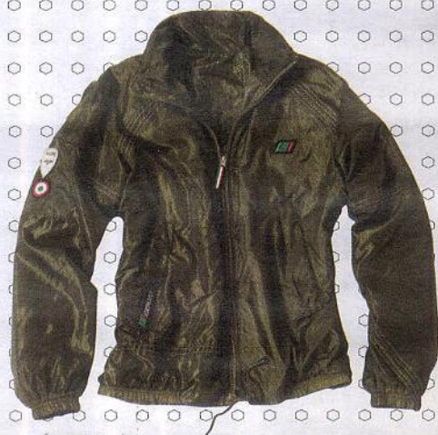
K-Way militar, Esercito Italiano.